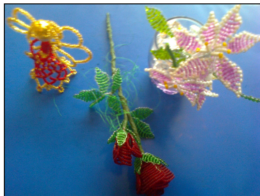
Ukázka výrobků z kroužku „Korálkování“

Bližší informace Vám rádi předáme v Centru pro zdravotně postižené Moravskoslezského kraje o. p. s. Přijďte strávit příjemné dopoledne, jste srdečně zváni.