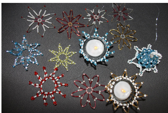
Ukázka výrobků z „Korálkování“