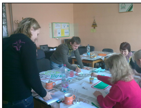
Podpůrné skupiny - Moje vysněná práce

Největší zájem je projeven především o aktivitu Výuka na počítači, se kterou jsou všichni účastníci velmi spokojeni. Dosud byly realizovány např. tyto rekvalifikace: Manikúra a modeláž nehtů, pedikúra, Pečovatelka o děti, Masér – lymfatické masáže, Pracovník sociální péče. Pro názornou ukázkou předkládáme fotografie z projektových aktivit.