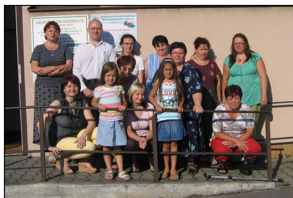
Kolektiv pracovníků detašovaného pracoviště Opava

Celoročně jsme zajišťovali kurz individuální výuky na PC, který absolvovalo 19 klientů a přednáškové akce (např. na téma finanční poradenství, diabetes, canisterapie). Pouze v prvním pololetí roku jsme zajistili také 22 lekcí arteterapie, kterou pravidelně navštěvovalo 7 uživatelů.